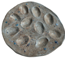
7-10 de abril Bandeja de huevos