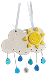
31 de marzo - 4 de abril Atrapa Sol Arcoíris