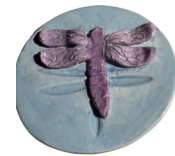
Del 28 de abril al 1 de mayo Soporte para palillos con tema de insectos