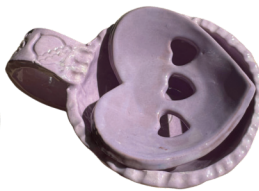
14-17 de abril Separador de Huevos